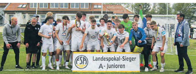
Die U19 konnte durch einen Treffer in der Verlängerung den FSA-Pokalsieg bejubeln.

1. FC Magdeburg U19: Kampa - Meier (108. Krüger), Achtenberg, Ruffing (91. Mehnert), Schültke (76. Elekwa), Birk, Marks (