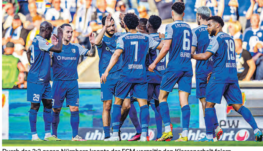
Durch das 2:2 gegen Nürnberg konnte der FCM vorzeitig den Klassenerhalt feiern.

Nach der Halbzeitpause wechselten beide Trainer jeweils nicht. Zehn Minuten nach Wiederanpfiff kamen die Gäste durch den Ex-Magdeburger Lohkemper zum Ausgleich. Kurz nach der Stundenmarke verfehlte Tempelmann das Gehäuse von Boss unten rechts. Kurz darauf hatte Boss einen