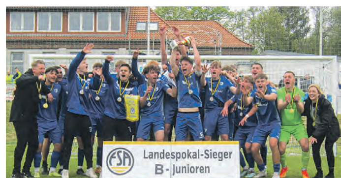
Auch die U17 sicherte sich in Thale den FSA-Pokal.