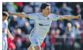
In Stendal konnte die U23 vorzeitig den Aufstieg in die Oberliga bejubeln.

te Vyrvch eine gute Chance zum Ausgleich per Kopf, im Gegenzug verpasste Romdhane die große Gelegenheit auf das zweite Tor. In der 38. Minute konnte Haffke nach einem schönen Zuspiel von Romdhane aus zentraler Position auf 2:0 erhöhen. Kurz vor dem Halbzeitpfiff hatten die Gastgeber noch eine Freistoß-Chance durch Matvyeyev, die jedoch