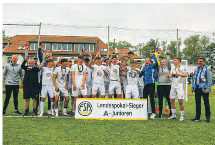
Die U19 des 1. FC Magdeburg siegte mit 3:2 im Landespokal und holte den „Pott“.

Ich habe keine Lieblingsmannschaft unter den NLZ-Teams, bin sozusagen „Fußball-Single“. Obwohl: es könnte naheliegender die U19 sein; drei Hähken stehen seit letztem Wochenende auf der Haben-Seite der A-Junioren: im Landespokalfinale besiegten die Jungs in Neinstedt die Mannschaft des Halleschen FC mit 3:2 in der Verlängerung und sind damit nicht nur für die erste Runde im DFB-Pokal qualifiziert, sondern konnten sich als