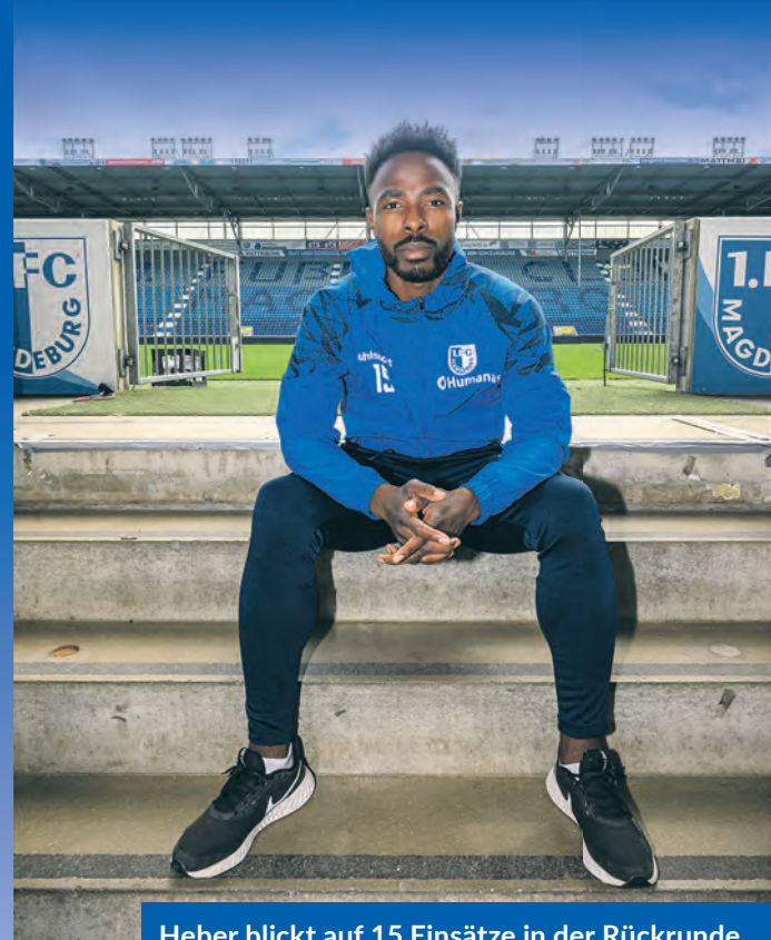
Heber blickt auf 15 Einsätze in der Rückrunde.